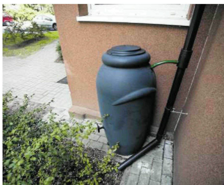
● W takich beczkach można by gromadzić deszczówkę do podlewania ogródków

Pomysł na walkę z suszą, który proponuje Banaś, nie jest nowy. Przykłady innych miast też dowodzą, że mieszkańcom zależy, by w takich przedsięwzięciach uczestniczyć. Ba, zyskały już popularną nazwę Beczka plus. ●