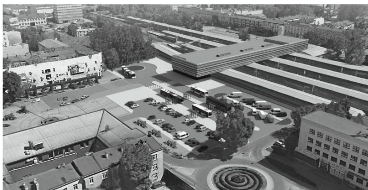
• Ogłaszając wyniki konkursu, prezentowano tylko wariant tzw. koncepcyjny, ale nie pokazano, jak będzie wyglądał plac bez dworca. Zrobiła to teraz Grupa Elanex (powyżej i na okładce): widzimy wielką pustkę z parkingiem