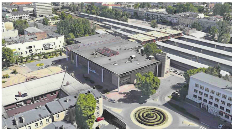
• Obecny widok dworca głównego

PKP SA nie chce korzystać z budynku przy pl. Rady Europy, choćby częściowo. Naszym