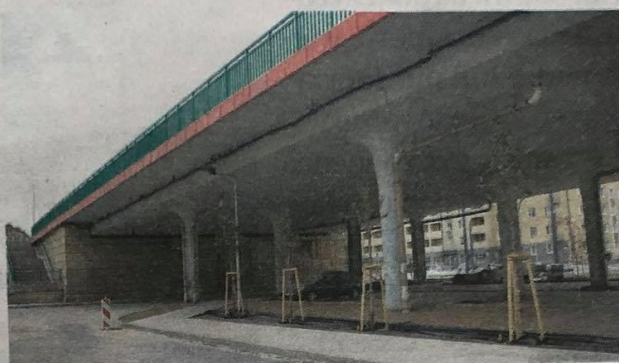
• Drzewa pod wiaduktem – zamiast nich w tym miejscu sprawdziłyby się pnącza oplatające filary

Najbardziej drzewa przydałyby się na przystankach tramwajowych w al. Pokoju. Gdy wycięto tam dorodne drzewa, które przez lata dawały pasażerom zbawienny latek cienia (przystanki są po słonecznej stronie ulicy) – rzecznik rozesłał do mediów mail pt. „Kaźde drzewo na wagę złota”. Informował w nim, iż wycinka wynika z „dostosowania do nowych warunków technicznych wynikających z ustaw i rozporządzeń, które znacznie różnią się od tych sprzed 60 lat”, gdy budowano linię tramwajową. I zapewnił, iż jej remont „nie zmieni charakteru al. Pokoju słynącej z bujnej roślinności, przeciwnie, doprowadzi do poprawy liczebności stanu zieleni” (bilans miał wynieść plus 15).