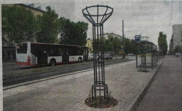
• Przystanki w al. Pokoju – tu akurat potrzebne są drzewa, ale je wycięto, zaś w osłonach posadzono pnącza

W „Wyborczej” krytykowaliśmy wtedy, że „niezbędną infrastrukturę przystankową”, na którą przy wycince powoływało się MPK, stanowią właśnie, a może przede wszystkim drzewa, bo rurę można wymienić, zaś dużego drzewa dającego cień nie da się zastąpić. Wówczas zaczęły napływać do nas sygnały, że mogą zostać posadzone nowe drzewa. Świadczyć mogły o tym metalowe osłony (znane z wielu