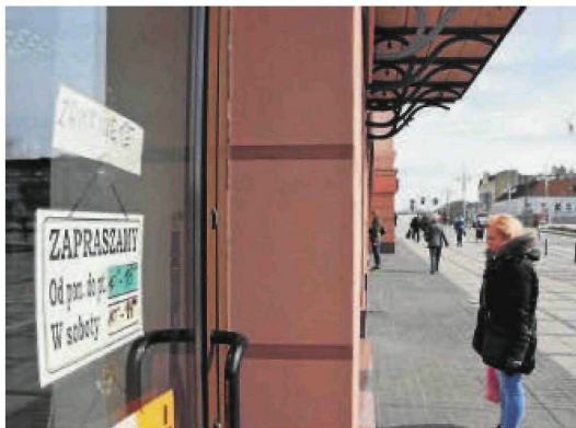
Z powodu pandemii koronawirusa wiele sklepów i lokali w Częstochowie było zamkniętych

Oplata prolongacyjna to oplata wnoszona przez podatników, którym na mocy decyzji organu podatkowego (w tym przypadku Miasta Częstochowy) odroczone termin płat-