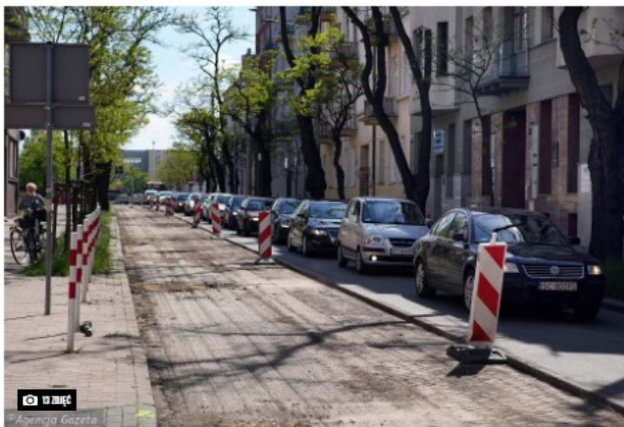
Częstochowa, 18 maja 2020 r. Remont ul. Śląskiej

Z początkiem tygodnia zaczęły się roboty przy naprawie ul. Śląskiej. Drogowcy zerwali starą nawierzchnię i układają nowy dywanik. Rozpoczęli też prace przy naprawie chodnika.