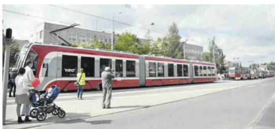
• Otwarcie linii tramwajowej na Wrzosiwiaku w 2012 r. – numer 2 wśród osiągnięć Częstochowy w ostatnich 30 latach.

– W przypadku Alej i placu Biegańskiego na tę potrzebę unowocześniania Częstochowy nałożyło się znaczenie traktu dla mieszkańców – mówi prof. Bylok. – W jednym z naszych badań to Aleje wskazywali, zaraz po Jasnej Gó-