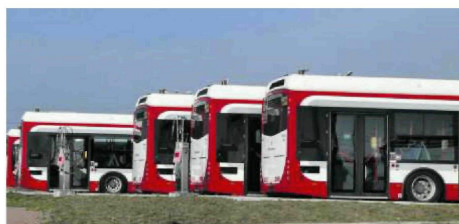
• Hybrydy jeździły niespełna rok. Od trzech lat stoją na kołkach

Według prezesa MPK za wcześnie, by mówić o przyszłych kosztach. – Będziemy testować autobus przez około trzy miesiące, jak wszystko będzie dobrze, to wtedy będziemy decydować, co z kolejnymi. Na dzień dzisiejszy nie możemy wybiegać tak w przyszłość jak pan radny. Zastanawiamy się nad tym, żeby kolejne autobusy naprawiać już u siebie, ale za wcześniej jest jeszcze, żeby móc powiedzieć, jaką decyzję podejmiemy – zastrzega Sikora.