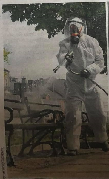
Dezynfekcję zaplanowano na maj, czyli miesiąc, w którym przybywa spacerowiczów