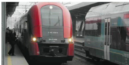
• Po lewej jeden z elfów należących do Polregio

Polregio, jeden z największych przewoźników kolejowych w Polsce, zapowiedział, że na nowo utworzy swój śląski zakład.