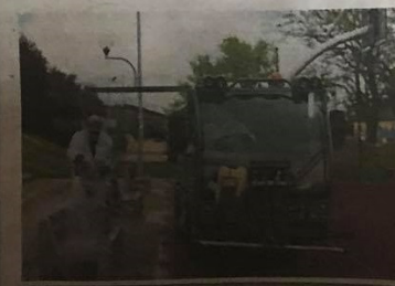
Dezynfekcję przeprowadzono również na Promenadzie Czesława Niemena