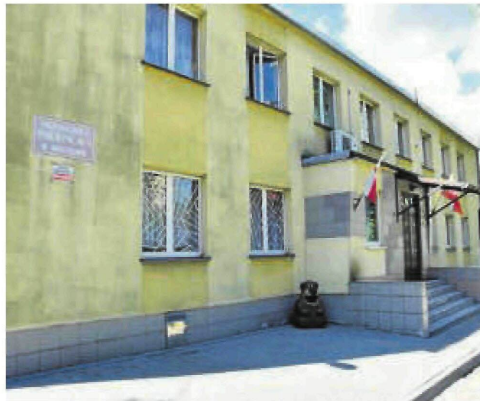
W Myszkowie przedszkola zostaną otwarte w najbliższą środę 13 maja. W Częstochowie pierwsze dzień później, 14 maja

W poniedziałek 18 maja działać już będzie Miejskie Przedszkole nr 44 im. Janusza Korczaka na Zawodziu Dąbiu, które będzie przygotowane na przyjęcie 14 dzieci oraz MP