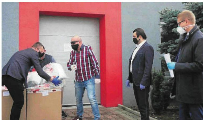
Prawie tysiąc przyłbic trafiło do kilku częstochowskich organizacji i instytucji