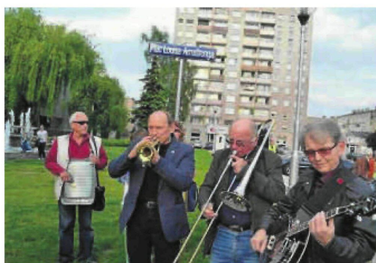
Podczas Festiwalu Jazzu Tradycyjnego Jazz Spring odbywały się koncerty plenerowe, z Paradą Nowoorleańską

Filharmonia też nie może organizować też innych koncertów. W zapowiadanym przez rząd stopniowym planie „odmrażania” życia gospodarczego i społecznego przywrócenie działalności filharmonii ma znaleźć się w ostatnim jego etapie. Nie wiadomo na razie, kiedy on nastąpi. Nowy rygor sanitarny dla polskich filharmonii - a także teatrów, oper czy baletów - ma określić zespół roboczy powołany przez Instytut Teatralny im. Zbigniewa Raszewskiego oraz Instytut Muzyki i Tańca we współpracy z Departamentem Narodowych Instytucji Kultury Ministerstwa Kultury i Dziedzictwa Narodowego. Szczegóły tych regulacji mają zostać ujawnione do połowy maja. ©©