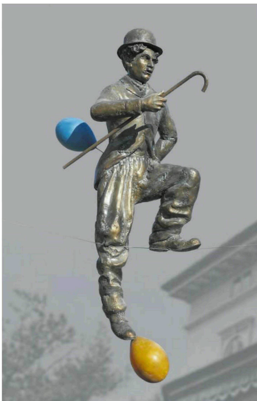
• Gag z balonami. Charlie Chaplin, inny gość specjalny - może zdąży na inaugurację?

Dla odmiany do USA nie może dotrzeć „Podróżujący linoskoczek”, rzeźba ku czci tego samego Philippe Petit, a miała towarzyszyć wydarzeniu z okazji okrągłego jubileuszu francuskiego akrobaty (ma dziś 70 lat). Na szczęście rzeźba dla Częstochowy to nie ma artystyczny bliźniak tej amerykańskiej. ■