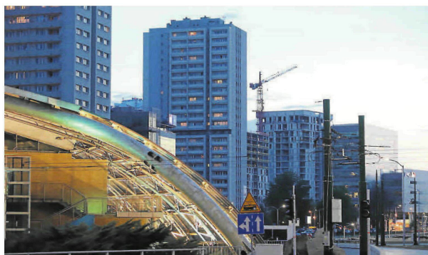
Katowice wciąż szacują, ile stracą na epidemii. Władze miasta szukają także oszczędności w magistracie i jednostkach miastu podległych. Katowicki Pakiet Przedsiębiorcy to koszt ok. 25 mln zł

- To nie Tarcza 3.0, tylko mniej niż zero, jeśli chodzi o samorządy - komentuje Arkadiusz Chęciński, prezydent Sosnowca. - Nie ma w niej nic, co dawałoby samorządom wprost jakiegokolwiek środka na funkcjonowanie. Z jednej strony jest mowa, że samorządy mogą przeznaczyć fundusze alkoholowe na walkę