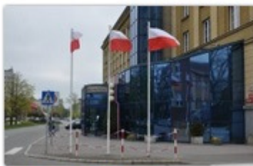
fol. UM Częstochowy

W Częstochowie tradycyjnie w pierwszy majowy weekend odbędą się uroczystości upamiętniające majowe święta i rocznice - ze Świętem Konstytucji 3 Maja. Tym razem ze względu na epidemię koronawirusa z zachowaniem niezbędnych środków ostrożności.