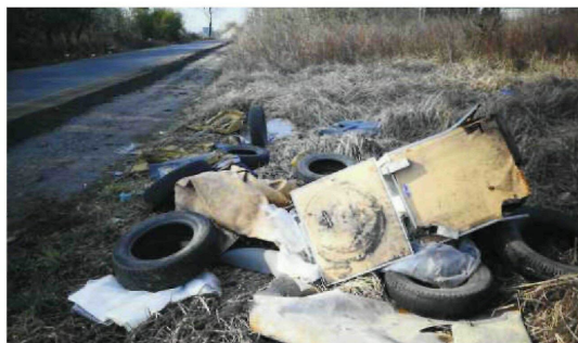
• Śmieci przy ul. Solnej na Wyczerpach.

Idąc do lasu na spacer czy pobiegać – już wolno! – wypadaloby zabrać ze sobą worek na śmieci. Pusty, bo szybko można go wypełnić leżącymi po drodze papierami, butelkami, szmatami. Przybywa ich w zastraszającym tempie. Niektórzy, korzystając z tego, że zielone tereny przez dłuższy czas były opustoszałe, wywozili tam śmieci. Dziś łąki, zagajniki czy lasy w Częstochowie i wokół niej bardziej przypominają wysypiska niż miejsca, w których króluje przyroda. Tam, gdzie możliwy był dojazd samochodem, wandalę stworzyli gruzowiska. I to nie jest przenośnia. Widać ślady po gruntowych remontach. Wśród drzew walają się cegły, zerwane kafelki, wykładziny, okienne ramy. Ktoś pewnie kupił sobie nowy telewizor, bo ten stary, kineoskopowy porzucił pod krzakiem. Jak dobrze się rozejrzeć, to może gdzieś w pobliżu leży magnetowid. A może w porozwalanych worach znajdziemy i kasety wideo. Tylko że nie jest miejsce na seans retro dla kinoma-