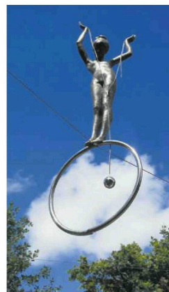
• Dziewczynka na obręczy – „wysłanniczka Picassa”