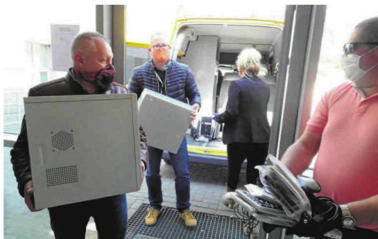
Miejski Zarząd Dróg i Transportu przekazał komputery szkołom. Zestawy komputerowe zostały przewiezione bezpośrednio do placówek, skąd zaborą je potrzebujący uczniowie

Warunkiem korzystania z elektronicznych narzędzi urzędowych jest posiadanie