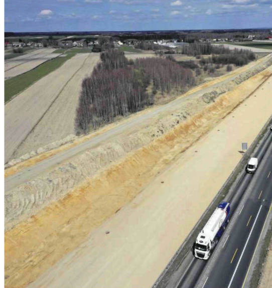
• Gotowa do układania betonowej nawierzchni zachodnia jezdnia na północ od Częstochowy

To rodzi problemy związane z likwidacją wielu zjazdów, które istniały przez pół wieku. Okoliczne samorządy - gminy i powiaty - od wielu lat walczą o dobudowę odcinków dróg, które mogłyby zrekompenzować brak bezpośredniego dostępu do autostrady. A także o remont dróg zniszczonych bądź uszkodzonych w wyniku ruchu pojazdów budowlanych czy też prowadzenia przez nie objazdów. ●