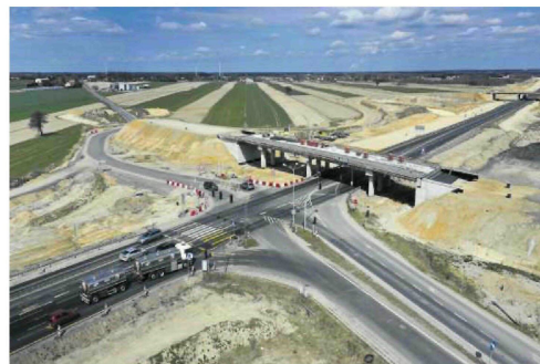
• Wszystkie skrzyżowania zostaną zastąpione wiaduktami