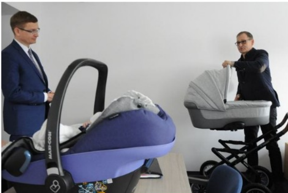
Wózki dla dzieci urodzonych w Częstochowie dzięki metodzie in vitro Urząd Miasta