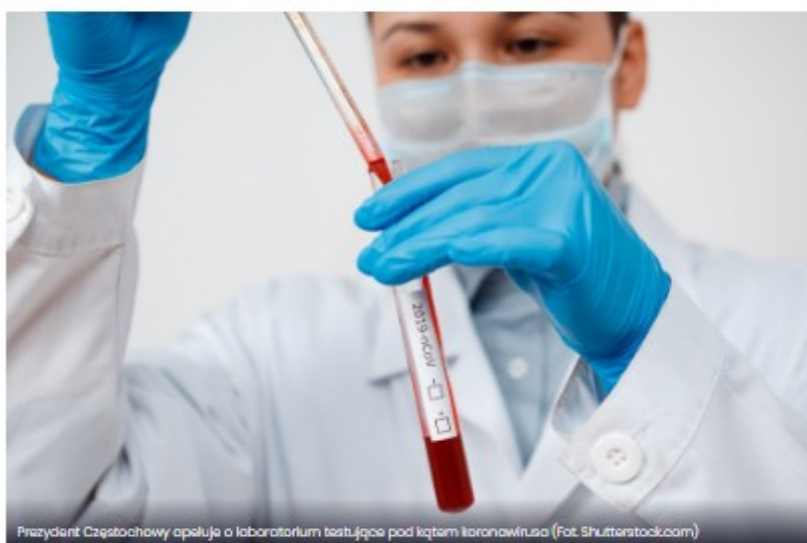
Prezydent Częstochowy apeluje o laboratorium testujące pod kątem koronawirusa

O uruchomienie w północnym subregionie woj. śląskiego laboratorium, w którym wykonywane byłyby testy na obecność koronawirusa zaapelował do ministra zdrowia prezydent Częstochowy. Jak argumentuje, oczekiwanie na wyniki testów trwa tam nierzadko kilka dni.