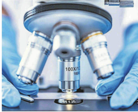
Czy w północnej części województwa śląskiego uruchomione zostanie kolejne laboratorium?