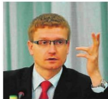
Prezydent Częstochowy, Krzysztof Matyjaszczyk sceptycznie mówi o wyborach

Krzysztof Matyjaszczyk, prezydent Częstochowy, uważa, że w obecnej sytuacji organizacja wyborów prezydenckich 10 maja 2020 jest niemożliwe. - To szaleństwo i niepotrzebne narażanie życia i zdrowia ludzkiego - mówi. Wysłał już zapytania m.in. do Sanepidu i Państwowej Komisji Wyborczej, aby uzyskać od tych instytucji informacje, jak przeprowadzić wybory w sposób bezpieczny.