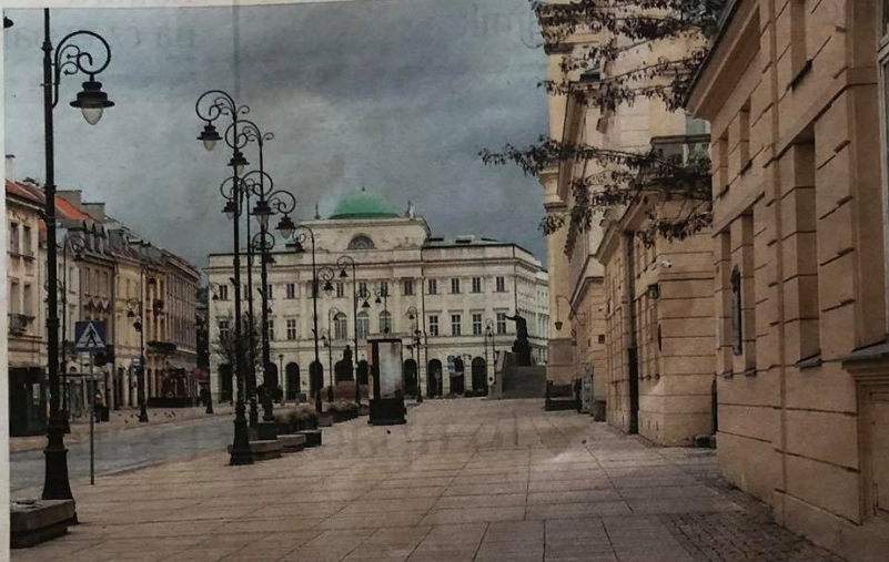
Ulice miast opustoszały. Restauracje, kawiarnie, lokale usługowe są zamknięte, a ich właściciele liczą straty