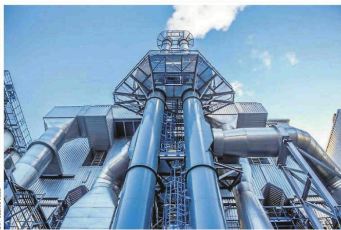
Spalarnie i instalacje paliw alternatywnych budzą gorące protesty mieszkańców. W Częstochowie budziła je planowana inwestycja przy ulicy Dojazdowej