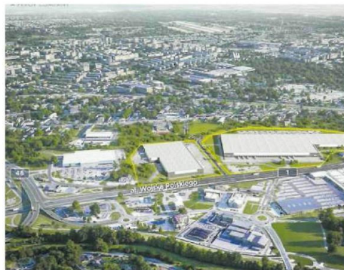
• Wizualizacja inwestycji

Hillwood z amerykańskim rodowodem to jedna z globalnych firm z branży nieruchomości komercyjnych z ponad 30-letnim doświadczeniem w realizacji inwestycji w Europie i Ameryce Północnej. Na świecie stworzyła 16 mln m kw. powierzchni magazynowej, z czego w Polsce ponad milion. W Polsce od 2014 r. buduje nowoczesne centra logistyczne i przemysłowe, zarówno w formule BTS („szyte na miarę”), jak i na wynajem. Firma zajmuje się również akwizycjami i zarządzaniem nieruchomościami.