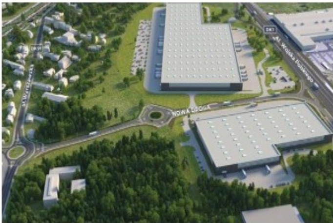
Fot. wizualizacja drogi