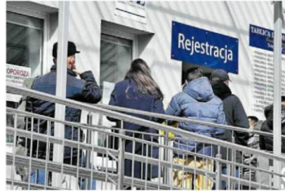
• Brak wytycznych NFZ doprowadził do chaosu. Jedne poradnie działają normalnie, inne są zamknięte na klucz. Na zdjęciu: kolejka do przychodni w Częstochowie

W Funduszu nie działa też sprawnie system elektronicznego obiegu dokumentów.