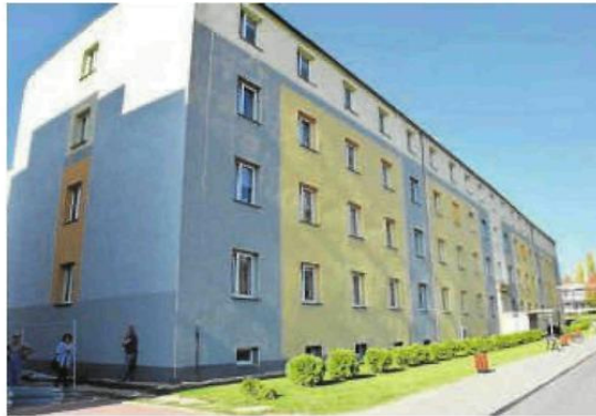
Akademik Bliźniak należący do Politechniki Częstochowskiej został przeznaczony dla osób poddanych kwarantannie

Pierwszy potwierdzony przypadek zarażenia na koronawirusa w Częstochowie stwierdzono we wtorek. To sześćdziesiątka dziew-