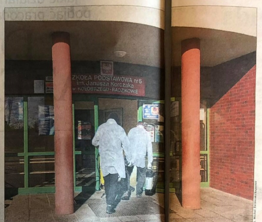
W przypadku zamknięcia placówek oświatowych nauczyciele dostaną wynagrodzenia

będziemy kupować rzeczy trwałego użytku, bo to wymaga wyjścia do sklepu. Przewidujemy, że po II kwartale nastąpi znaczące odbicie konsumpcji. Pod warunkiem oczywiście, że epidemia koronawirusa nie przybierze poważniejszej skali. Czy i w jakim stopniu zamknięcie szkół wpłynie jeszcze na gospodarkę? Tu są znaki zapytania: jak zachowują się przedsiębiorcy, ilu ostatecznie pracowników pozostanie w domu z dzieckiem. Może się okazać, że dzieci będą oddawane pod opiekę dziadków, starszego rodzeństwa, pracodawcy będą zastępować pracowników innymi, wykorzystywać zapasy, żeby na czas realizować usługi. @ @