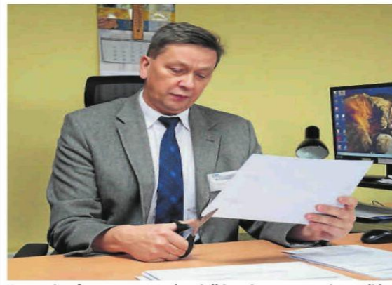
Otwarcu ofert towarzyszyło wielkie zainteresowanie mediów

Pierwsze ważne decyzje w sprawie przetargu na wykonawcę modernizacji stadionu powinny zapaść już w przyszłym tygodniu. ©©