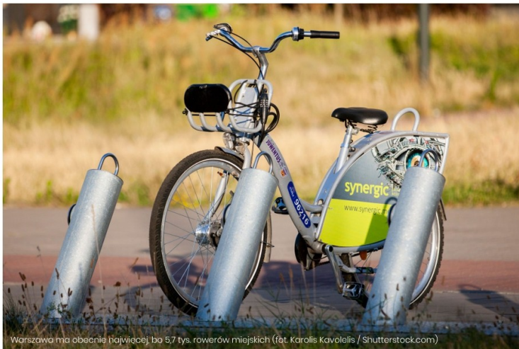
Warszawa ma obecnie najwięcej, bo 5,7 tys. rowerów miejskich

Od kilkuset tysięcy do nawet kilkunastu milionów złotych rocznie – tyle samorządy wydają na utrzymanie systemów rowerów miejskich. Koszty utrzymania jednego roweru w systemie to kilka tysięcy złotych za rok. 1 marca rusza kolejny sezon rowerów miejskich. Sprawdziliśmy ile poszczególne miasta wydały na nie w 2019 roku.