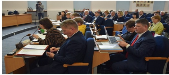
Częstochowscy radni przyjęli jednogłośnie dwie uchwały. Przesuwać zdjęcia w prawo - następną strzałkę lub przycisk NASTĘPNE