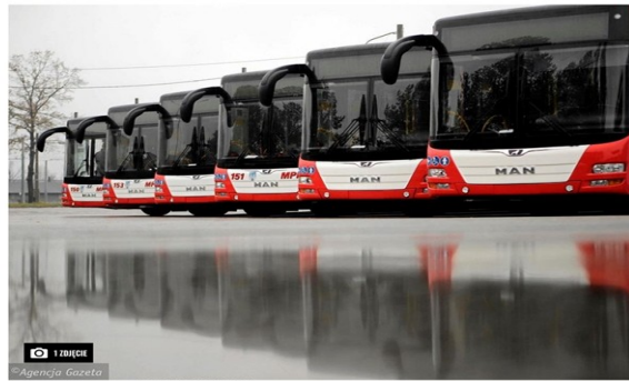
Autobusy MPK Częstochowa (GRZEGÓRZ SKOWRONEK)