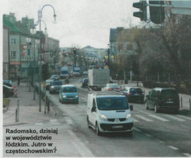
Radomsko, dzisiaj w województwie łódzkim. Jutro w częstochowskim?