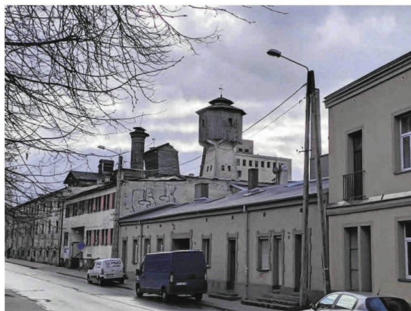
Browar to wspaniałe świadectwo historii przemysłowej miasta, ale jego budynki niszczej