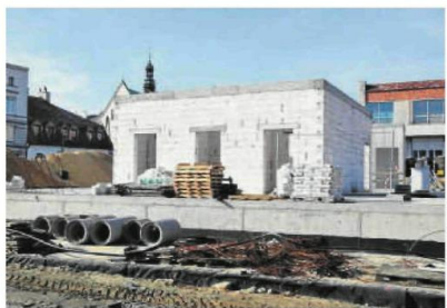
Tak wygląda zarys nowego pawilonu, który budowany jest w ramach rewitalizacji Starego Rynku w Częstochowie

Od godz. 6.00 na ul. Mirowskiej wyznacza się jeden kierunek ruchu z wjazdem od Placu Daszyńskiego i wyjazdem w kierunku skrzyżowania z ul. Nadrzeczną. W kierunku Placu Daszyńskiego wyznacza się objazd od ul. Mirowskiej następującymi ulicami: Nadrzeczną, Spadek oraz Warszawską. W przypadku dużego natężenia ruchu proponowany jest także objazd alternatywną relacją wiodącą ulicami: Nadrzeczną i Warszawską z pominięciem skrzyżowania w ul. Spadek. Ponadto zamknięty będzie chodnik po południowej stronie ul. Mirowskiej od skrzyżowania z ul. Targową do posesji nr 14. Prace będą trwać do połowy maja. Miejski Zarząd Dróg i Transportu w Częstochowie poinformował również, że w związku z pracami drogowymi na ulicy Mirowskiej na odcinku od ulicy Nadrzecznej do Placu Daszyńskiego od wtorku 18.02.2020 r. do odwołania nastąpi zmiana tras linii nr 11, 13, 18, 21, 24, 26, 27, 28, 31 i 84 w kierunku centrum. ©©