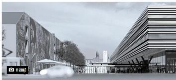
Konkurs na dworzec w Częstochowie - I nagroda. Widok od strony pl. Rady Europy

Konkurs został podzielony na dwie części: realizacyjną i studialną. Pierwsza zakłada, że po wschodniej stronie, na prawo od dworca ma powstać wieża zegarowa. W samym budynku na parterze znajduje się hala z kasami i biletomatami. W łączniku nad torami przewidziano poczekalnię oraz lokale gastronomiczne i użytkowe, a także kaplicę. Z kolei od strony al. Wolności przewidziano znacznie mniejszy budynek z biletomatami, kasami i małą poczekalnią. Przed dworcem, po jego zachodniej stronie przewidziana jest budowa przystanków autobusowych, a co kolei wymusza przedłużenie ul. Orzechowskiego, która kończyłaby się miejscem do zawracania. I to na pewno powstanie. Niewiadoma dotyczy części studialnej, gdzie autorzy zaproponowali przedłużenie łącznika biegnącego nad torami, aż do al. Wolności – w jego wnętrzu byłyby sklepy i usługi – dzięki czemu uzupełniona zostałaby pierzeja al. Wolności. Pomiędzy dworcem a al. Wolności autorzy zlokalizowali jeszcze jeden budynek przeznaczony na działalność usługową.