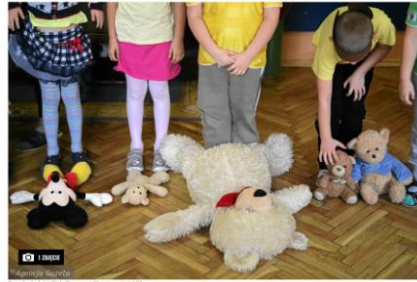
Pracownia Szkolnictwa

Pracownia Szkolnictwa 5 lutego 2020 11:07