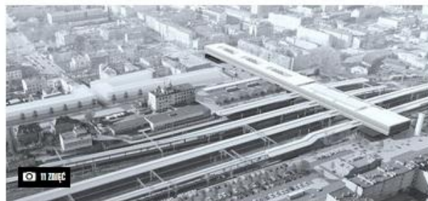
Konkurs na dworzec w Częstochowie - I nagroda. Widać pasaż nad torami wydłużony aż do samej ul. Wolności; w miejscu obecnego gmachu dworca - dworzec autobusowy (pod pasażem)