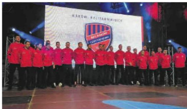
Wczoraj wieczorem piłkarze Rakowa po powrocie z Cypru zaprezentowali się kibicom w Hali Sportowej Częstochowa

„W przypadku otrzymania dofinansowania na poziomie 10.000.000 zł z Ministerstwa Sportu, Miasto Częstochowa zobowiązuje się zabezpieczyć w budżecie środki finansowe w wysokości 7.500.000 zł, stanowiące zabezpieczenie wkładu własnego wyłącznie na realizację inwestycji” - napisali częstochowscy radni w przyjętej uchwał.