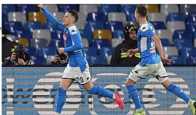
Napoli pokonuje Juventus w hicie!

Samo przygotowanie projektu to bowiem osiem miesięcy, a realizacja całego przedsięwzięcia to około osiemnastu miesięcy, co oznacza, że nie ma najmniejszych szans, by stadion Rakowa - dochowując wszystkich przepisów i staranności - mógł zostać w pełni zmodernizowany w ciągu jednego roku.