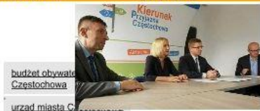
budżet obywatelski Częstochowa urząd miasta C