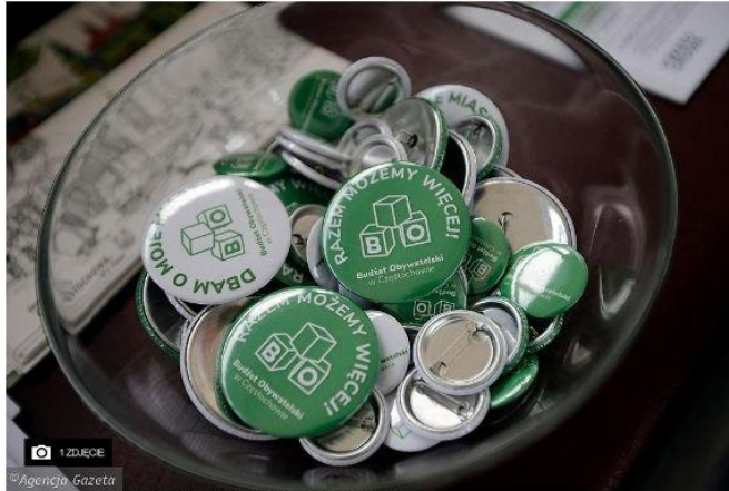
Budżet obywatelski w Częstochowie

Urząd Miasta w Częstochowie przygotowuje się do startu kolejnej edycji budżetu obywatelskiego. Wcześniej chce wysłuchać opinii mieszkańców.