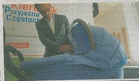
Każde dziecko urodzone dzięki miejskiemu programowi in vitro otrzymuje wózek od częstochowskiej firmy

sowania do zabiegu zapłodnienia pozaustrojowego w wysokości do 5000 zł pod warunkiem przeprowadzenia co najmniej jednej procedury. Pozostałe koszty procedury ponoszą pacjenci. Do częstochowskiego programu leczenia bezpłodności metodą in vitro mogą zostać zakwalifikowane pary, które spełniają przyjęte w programie kryteria. Kobieta powinna być w wieku 20-37 lat, przy czym liczy się tu rocznik, a nie konkretna data urodzenia, czyli dzień, miesiąc, rok. Ponadto para starająca się o dofinansowanie musi zostać zakwalifikowana do leczenia tą metodą przez realizatora programu, zgodnie z wytycznymi Polskiego Towarzystwa Medycyny Rozrodu. Para musiała wcześniej przejść tak zwane leczenie niższego rzędu, które zakończyło się niepowodzeniem, albo ma bezpośrednie wskazania do zapłodnienia pozaustrojowego. Jest to program tylko dla małżeństw. Pary, które otrzymują dofinansowanie z budżetu Częstochowy, mogą korzystać tylko ze specjalistycznych ośrodków. ● ©©