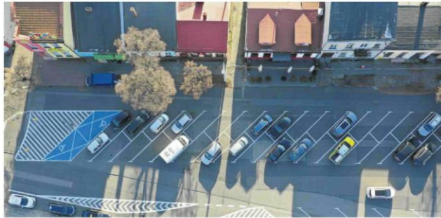
• Rynek Wieluński – miałyby go objąć, a także sąsiednie ulice, w tym św. Rocha, rozszerzona płatna strefa

Kierowcy powinni się także spodziewać wzrostu kar za brak opłaconego postoi. Obecnie to 50 zł, ale jeśli zapłacimy najpóźniej na drugi dzień – to tylko 25 zł. – W moim odczu-