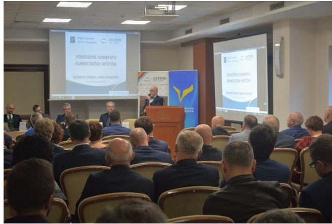
O planowaniu energetycznym mówiono podczas Konwentu Burmistrzów i Wójtów Śląskiego Związku Miast i Gmin

- Takie planowanie strategiczne powinno wyznaczać kierunki działań – najmniej kapitałochłonnych: edukacyjnych i zarządczych, a na końcu inwestycyjnych, które pozwolą nam podnieść efektywność energetyczną, ale jako dobry gospodarz musimy pamiętać, że efektywność energetyczna to jest dla nas także efektywność ekonomiczna, jak również środowiskowa – mówi przewodnicząca Komisji ds. Lokalnej Polityki Energetycznej SZGiP.