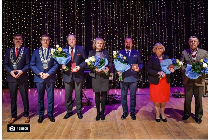
Spotkanie noworoczne w Filharmonii Częstochowskiej - nagrodzeni medalami Merentibus