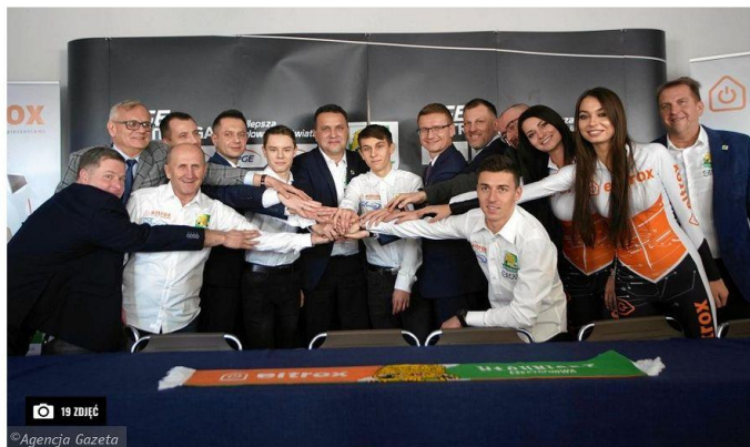
19 zdjęć Agencja Gazeta Fot. Grzegorz Skowronek / AG

We wtorek Włókniarz Częstochowa poinformował o tym, że w nadchodzących rozgrywkach sponsorem tytularnym będzie firma Eltrox. Z nowym sponsorem częstochowianie będą chcieli zdobyć medal, najlepiej złoty.