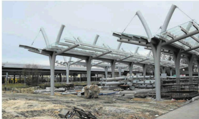
Budowa centrum przesiadkowego przy ulicy Piłsudskiego jest bardzo zaawansowana

Wokół będzie sporo zieleni, nowoczesna fontanna, miejsca do wypoczynku i rekreacji. Funkcję amfiteatru dla kameralnych imprez mają pełnić schody prowadzące do muzeum. Całość dopełnią balansujące rzeźby. W ramach tego zakresu przebudowany zostanie również fragment ulicy Stary Rynek przylegający do głównego placu. Drugi z nich obejmuje budowę ulicy Mirowskiej ze ścieżką sygnalizacją świetlną, zabezpieczeniem istniejących piwnic zlokalizowanych w ulicy i elemen-