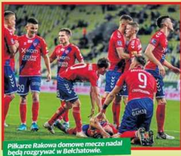
Piłkarze Rakowa domowe mecze nadal będą rozgrywać w Bełchatowie.

Wszystkie działania mają sprawić, że Raków mecze w PKO Ekstraklasie będzie mógł rozgrywać w Częstochowie. Od kiedy? Najprawdopodobniej nie wcześniej niż od końca 2020 roku. Miasto na inwestycję nie ogłosiło jeszcze przetargu. Częstochowa na przebudowę obiektu ma przekazać 7 mln zł, pozostałą kwotę ma dołożyć Ministerstwo Sportu i Turystyki.