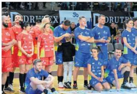
Do Częstochowy na "Świąteczne Granie z Kubą" przyjechały gwiazdy sportu, piosenki, kabaretu

Wielkie słowa podziękowania dla Kubę Błaszczkowskiego. To coś niesamowitego ściągnąć tak wielu sportowców, ludzi, którzy chcą pomagać dzieciom. Kuba to świetny kapitan drużyny - powiedział Piotr Małachowski ze zwycięskiej drużyny.