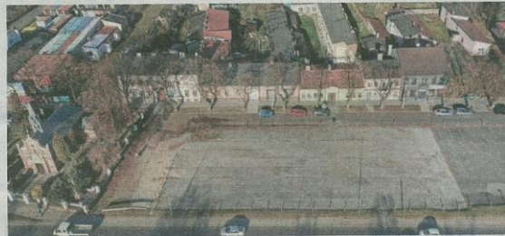
• Rynek Wieluński to olbrzymi plac. Widoczna na zdjęciu pustka stanowi ledwie jedną czwartą jego powierzchni.