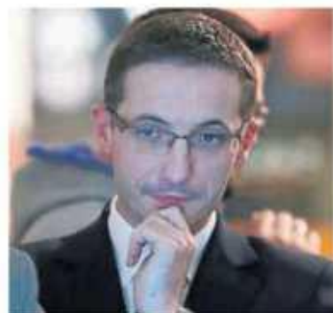
Piotr Kuczera, prezydent Rybnika: Ludzie muszą wiedzieć, to wina rządu

- Musimy ciąć wszystkie wydatki. Odczują to mieszkańcy. Chcemy, żeby wiedzieli, że to nie nasza wina, ale rządu, który zrzuca na nas kolejne obowiązki i nie zapewnia finansowania, co jest niezgodne z konstytucją - powiedział Piotr Kuczera, prezydent Rybnika. W tym mieście wstrzymane są praktycznie wszystkie inwestycje. Prezydent szczególnie żałuje centrum dla seniorów, które nie zostanie na razie zrealizowane. Mniejsze będą