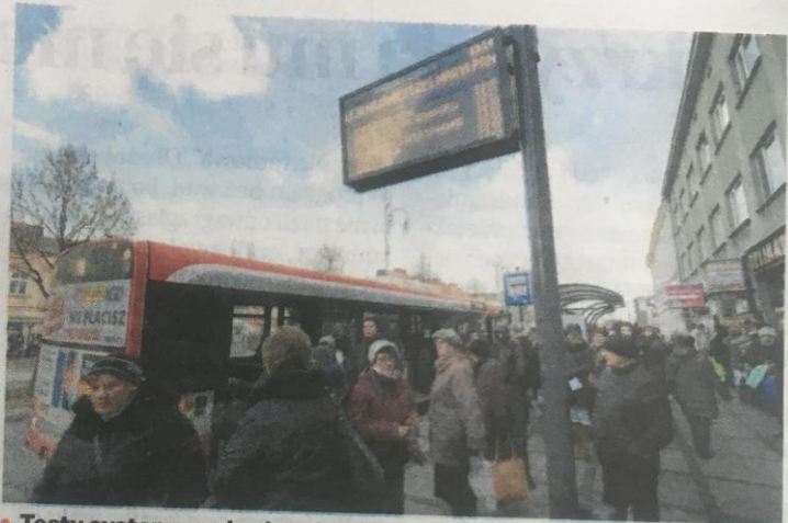
• Testy systemu mają się zakończyć w pierwszym kwartale 2020 r.

Faza testowa oznacza, że informacja nie jest jeszcze „dynamiczna”: wyświetlane są po prostu informacje z rozkładów papierowych. Ideą tego systemu jest zaś pokazywanie rzeczywistej pory odjazdu, czyli za ile minut przyjedzie np. spóźniony autobus. To bardzo przydatne, bo pasażer wie, czy pojazd, na który czeka, już odjechał (w Częstochowie standardem są częstotliwości 30-minutowe) czy jeszcze nie. Póki co tablice wprowadzają więc w błąd, zwłaszcza tych, którzy je znają z innych miast, bo dany autobus znika, jeśli minęła rozkładowa godzina odjaz-