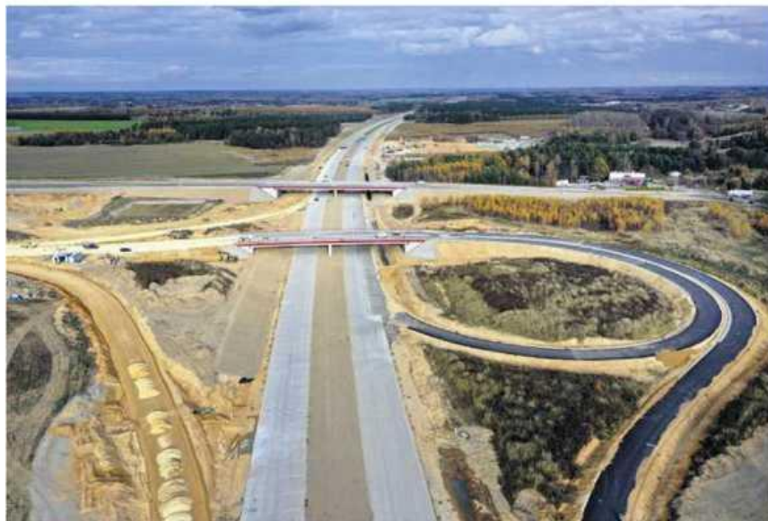
Przecięcie obwodnicy z drogą krajową nr 43 Częstochowa – Kłobuck.

– W obrębie węzła „Częstochowa Jasna Góra”, w ciągu ul. św. Rocha,