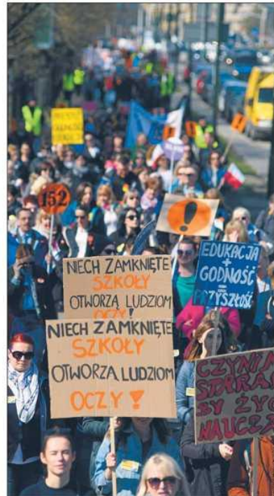
Podwyżki dla nauczycieli, jakie wprowadzono po ich akcji strajkowej, rujną z kolei budżety samorządów

Wciąż jeszcze udaje się oprócz Poznaniowi, który realizuje trzy programy polityki zdrowotnej. Na razie miasto chce je kontynuować w 2020 r. – na program profilaktyczny w zakresie grypy zostały po prostu zabezpieczone już środki w miejskim budżecie aż do 2023 r. Podobnie jak program w zakresie profilaktyki zakażeń wywołanych wirusem brodawczaka ludzkiego. Nie wiadomo, jakie będą kole-