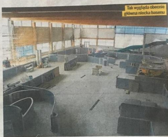
Tak wygląda obecnie główna niecka basenu

● Park wodny ma być gotowy do czerwca 2020 roku. Jak udało się nam dowiedzieć, termin zakończenia prac nie jest zagrożony