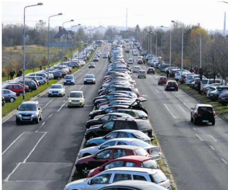
• Rozjeżdżanie trawników koło cmentarza Kule będzie 1 listopada legalne

• Cmentarz Kule. 1 listopada zamknięty zostanie ciąg ulic Dekabrystów – Waly Dwernickiego od Rolniczej do Fieldorfa-Nila. Nieprzejezdna będzie również ul. Cmentarna od Tartakowej aż po bramę cmentarza. Ruch jednokierunkowy będzie prowadzony ul. Rolniczą od ul. Dekabrystów i dalej Promenadą, skąd będzie można wyjechać w lewo ul. Brzeźnicką do ul. Dekabrystów lub w prawo ul. Wańkowicza do al. Wyzwolenia. Ruch jednokierunkowy na ul. Rolniczej i Promenadzie będzie obowiązywał przez cały weekend, do godz. 20 w niedzielę. W pobliżu największego cmentarza w mieście można będzie parkować na istniejących parkingach oraz na fragmencie ul. Fieldorfa-Nila od Promenady do przystanku MPK przy wejściu na cmentarz. • Cmentarz św. Rocha. W piątek kierowcy nie pojadą fragmentem ul. św. Jadwigi na odcinku od ul. św. Rocha do Kubiny (nie dotyczy to autobusów MPK i taxi). Aby dojechać na cmentarz od południa, kierowcy będą musieli pojechać ul. św. Jadwigi, a następnie w prawo w ul. Wyszyńskiego i dalej jednokierunkowymi ulicami Ewy, Kubiny. We Wszystkich Świętych ruch jednokierunkowy będzie obowiązywał także na ul. Sikorskiego, na któ-