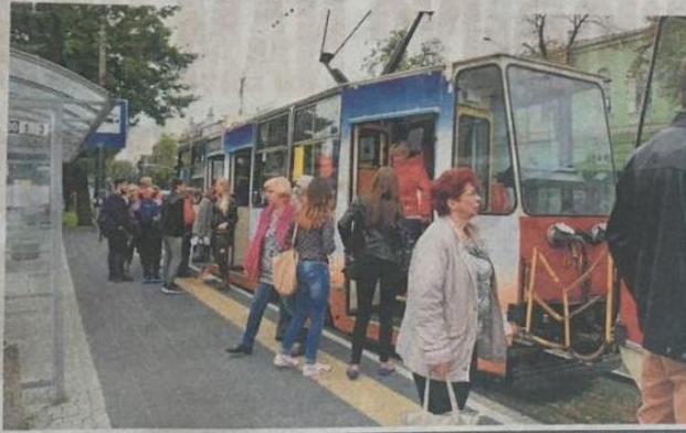
Zmiana taryf biletowych będzie obowiązywać już od jutra. Niestety dla większości mieszkańców Częstochowy oznacza to wysokie podwyżki cen za komunikację miejską

Bilet miejski jednorazowy normalny będzie kosztował 3,60 zł, a ulgowy 1,80 zł. Zmianie ulegną także ceny biletów podmiejskich, gdzie opłata za normalny wyniesie 5 zł, a ulgowy 2,50 zł. Proporcjonalnie zmienią