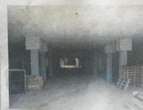
W szybkim tempie powstaje również parking podziemny, który będzie miał 46 miejsc