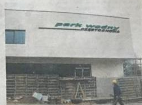
Tak wygląda obecnie park wodny z zewnątrz. Elewacja jest prawie gotowa