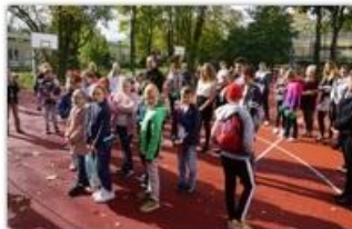
fol. UM Częstochowy

W Zespole Szkolno-Przedszkolnym nr 3 przy ul. Łukasińskiego oficjalnie otwarto w czwartek, 10 października nowe boisko wielofunkcyjne. Odbyła się też uroczystość pasowania na ucznia pierwszoklasistów.