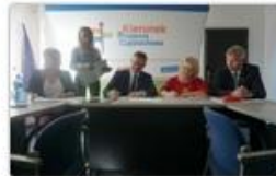
fol. UM Częstochowy

Wsparcie lokatorów w trudnej sytuacji życiowej, propagowanie profilaktyki zdrowotnej oraz przeciwdziałanie różnym formom uzależnienia i przemocy to główne cele podpisanego w piątek, 11 października porozumienia o partnerstwie „Wspólny Dom – wspólna sprawa” na rzecz organizacji i aktywizacji mieszkańców Częstochowy.