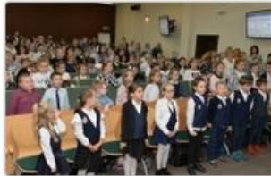
fol. UM Częstochowy

Na Politechnice Częstochowskiej zainaugurowana została 5. edycja Częstochowskiego Uniwersytetu Młodego Odkrywcę. Weźmie w niej udział 180 uczennic i uczniów szkół podstawowych.