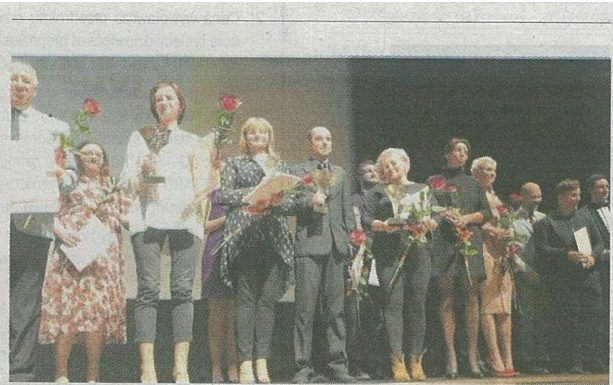
• Gala Ekonomii Społecznej w Filharmonii Częstochowskiej