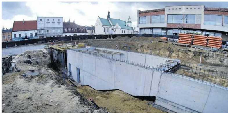
• Konsorcjum trzech firm, które realizuje inwestycję, zapewnia, że jej harmonogram zostanie dotrzymany.