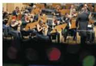
• Orkiestra Symfoniczna Filharmonii Częstochowskiej