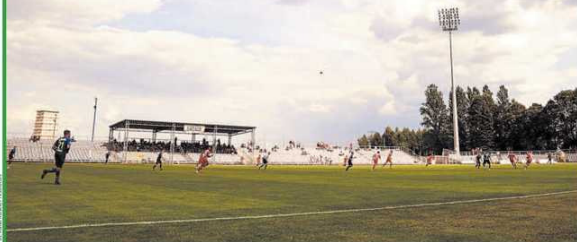
Ekstraklasa nie zawita szybko pod Jasną Górę...