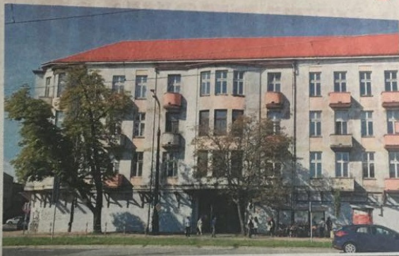
Dom Księcia jest jednym z najbardziej charakterystycznych budowli w Częstochowie. Budynek można kupić w drodze przetargu. Cena wywoławcza wynosi ponad 10 mln złotych

Długo sprzedaż tego zabytkowego obiektu była wręcz niemożliwa, bo nie było takiej