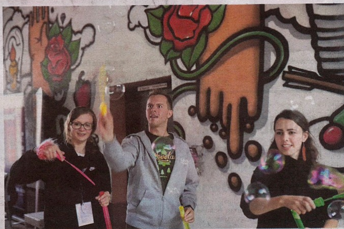
• Festiwal gier podwórkowych przy ul. Śląskiej