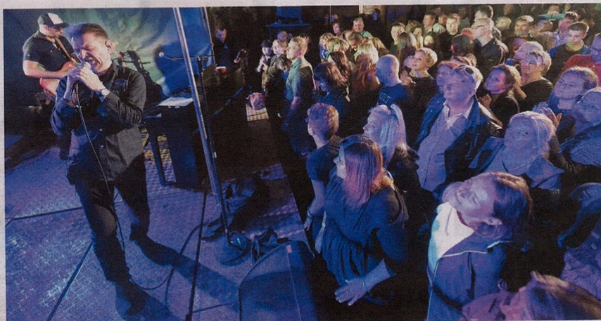
• Koncert zespołu Sztywny Pal Azji

Kto wziął udział w Nocy Kulturalnej, która już po raz 16. odbyła się w Częstochowie, na pewno nie żałował. Mimo że deszcz i chłód w sobotni wieczór nie sprzyjały zabawie, każdy mógł znaleźć coś dla siebie. Tym bardziej że program tegorocznej imprezy zawierał blisko sto wydarzeń! Zobaczcie na zdjęciach Grzegorza Skowronka i Magdaleny Krawczyk kilka z nich.