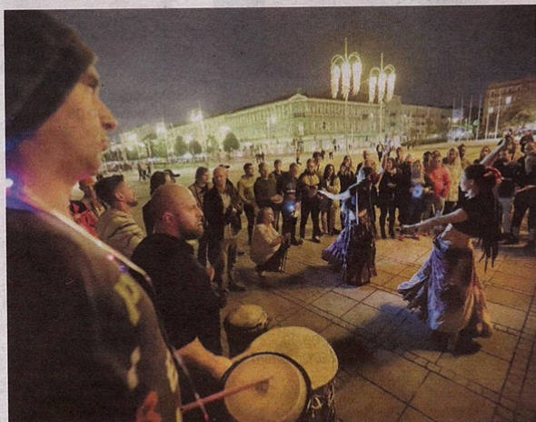
• Flash mob bębniarski na pl. Biegańskiego