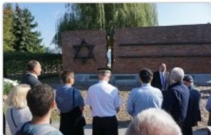
fol. UM Częstochowy

W Częstochowie odbyły się uroczystości upamiętniające 77. rocznicę likwidacji getta. Wydarzeniu towarzyszyło odsłonięcie tablicy poświęconej Żydom, pracującym niewolniczo w czasie II wojny światowej w niemieckiej fabryce amunicji przy ulicy Krakowskiej.