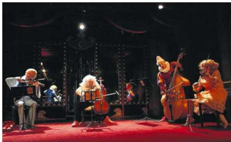
• Premiera „Siły przyzwyczajenia” odbędzie się 14 września.

Premierowe wydarzenia w niedzielę, 8 września o godz. 19 otworzy „Zaczarowany koń. Piosenki lat pięćdziesiątych”. Tytuł ten znany jest już częstochowskiej publiczności. Jako plenerowy koncert przedsięwzięcie zrealizowano bowiem na potrzeby miejskiego Festiwalu Retro, który odbył się na początku lipca. A ponieważ widzowie uwielbiają tego typu widowiska, narodził się pomysł stworzenia teatralnej wersji. Po-