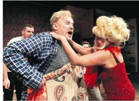
• Przedstawienie „Berek, czyli upiór w moherze 2” grane będzie 19 października

We wrześniu Filharmonia Częstochowska rozpocznie swój 75. sezon artystyczny. Jak zawsze oprócz własnych propozycji zaprosi ona również na szereg wydarzeń organizowanych przez zewnętrzne agencje i firmy.