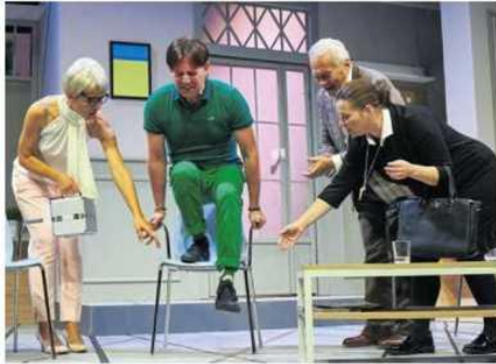
• Spektakl „Nerwica natręctw” zobaczymy 27 października