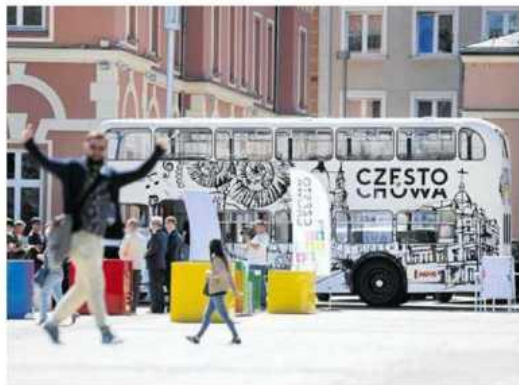
• Głosować można m.in. w „londyńczyku”, który objedzie częstochowskie dzielnice. Dziś zaparkuje na pl. Biegańskiego w godz. 12-18

Głosowanie rozpoczyna się dzisiaj. Potrwa do 25 września. Formuła głosowania nie zmieniła się. Mieszkańcy, którzy skończyli 13 lat, mogą zgłaszać na zada-