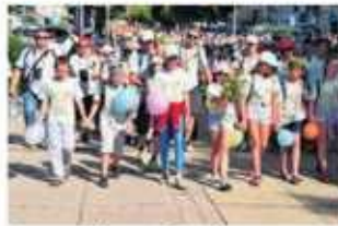
Jasną Górę odwiedza rocznie 4 miliony pielgrzymów

Teraz problem podatku od pielgrzymów wrócił za sprawą radnego lewicy, Se-