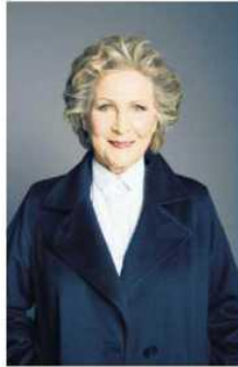
• 20 października wystąpi Irena Santor