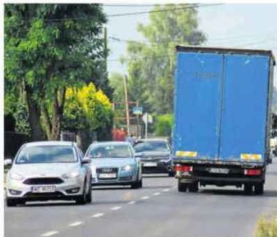
To codzienny widok na ulicy Dźbowskiej. Niekończący się sznur pojazdów to prawdziwe utrapienie dla mieszkańców