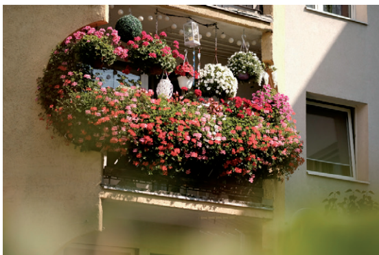
Balkon przy ul. Mościckiego 16