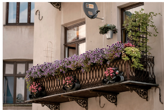
Balkon przy ul. Alei NMP 6