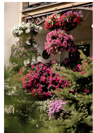
Balkon przy ul. Mościckiego 14