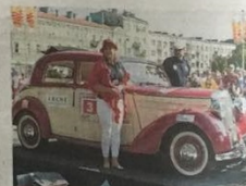
Zabytkowe pojazdy tradycyjnie zagościły na Placu Biegańskiego