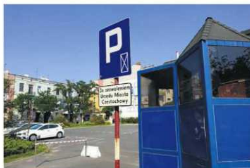
• Po niedzieli zaparkują tu tylko urzędnicy

Jesienią 2009 r. mieszkańcy za granicą spadkobiercy przedwojennej właścicielki fabryki lalek złożyli – bezskutecznie – wniosek do częstochowskiego magistratu o zawezwanie do próby ugodowej, domagając się wydania nieruchomości. Jednocześnie wszczęli starania o unieważnienie decyzji o upaństwowieniu po II wojnie fabryki, także w części, w której udziały miał właściciel zakładów Ferrum,