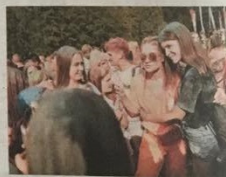
Wielkim zainteresowaniem cieszył się tegoroczny Festiwal Kolorów w Parku Lisinie