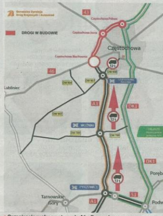
Organizacja ruchu po otwarciu A1 z Pyrzowic (Dobry Ziemia)

Tyle, że zanim się to stanie, mogą nas czekać ciężkie dni. Obwodnica ma być przejezdna do końca roku – jak przekonuje GDDKiA – lub do połowy przyszłego – co sugerują podwykonawcy. Jeśli spełni się ten drugi scenariusz, to jeszcze przed otwarciem obwodnicy znacznie się zapowiadają od dawna remont miejskiego odcinka „gierkówki”. Miasto dotąd zweekowało z rozpoczęciem prac w al. Wojska Polskiego, ale nie może już dłużej czekać, by zakończyć wszystkie prace i rozliczyć je do końca 2022 r. – co było warunkiem przyznania eurodotacji. MZDT chce więc zacząć roboty w przyszłym roku, choć konkretny termin oraz harmonogram nie jest jeszcze podany.