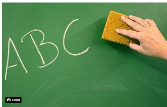
Szkołna tablica

Dorota Steinhagen 7 sierpnia 2019 | 16:10