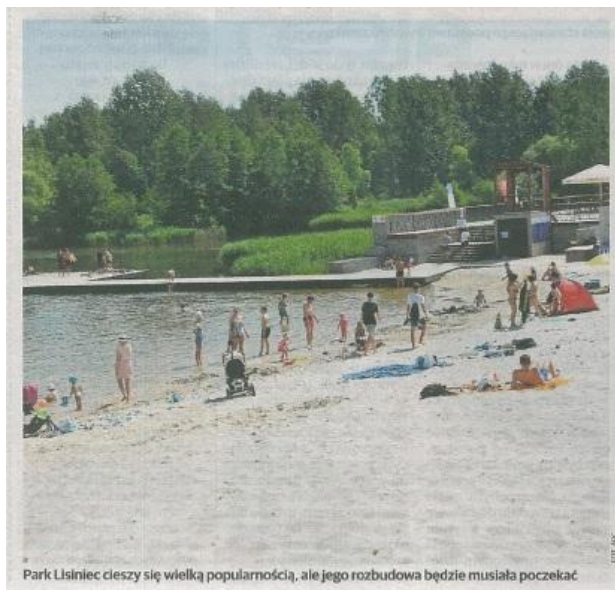
Park Lisiniec cieszy się wielką popularnością, ale jego rozbudowa będzie musiała poczekać

Jutro odbędzie się sesja nadzwyczajna Rady Miasta, podczas której wykreślonych lub przesuniętych w czasie zostanie wiele inwestycji. To m.in. budowa ul. Złotej wraz z odwodnieniem, ul. Traugutta, ul. Lwowskiej, drogi gminnej od ul. Połanieckiej do węzła DK-1 z A-1, ul. Żyznej, rozbudowie ul. Boya-Zeleńskiego, przebudowie oświetlenia ulicznego wzdłuż trasy tramwajowej. Zabraknie środków na przebudowę chodników i miejsc parkingowych przy ul. Filomatów, na budowę połączenia rowerowego ul. Piłsudskiego z ul. Wróblewskiego, na budowę chodnika i kanalizację teletechniczną przy rondzie ks. Stanisława Guzika, budowę ul. Obroniców Westerplatte. Nie powstanie wybieg dla psów, nie zostanie przebudowana sala gimnastyczna w ZSP nr 2 przy ul. Olsztyńskiej, nie rozpocznie się budowa nowej linii tramwajowej na Parłotkę, nie będzie kontynuowana rewitalizacja Parku Lisiniec.