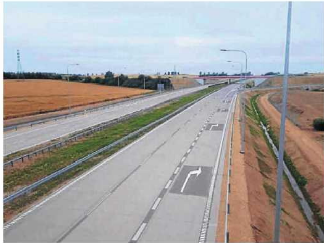
Autostrada między Pyrzowicami i Częstochową ma być otwarta w najbliższych tygodniach