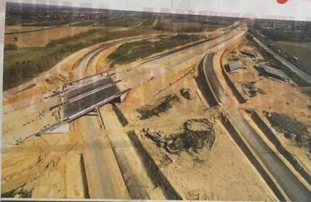
Adaptacja trasy DK1 na północ od Częstochowy na autostradę to zadanie stwarzające mnóstwo problemów podróżującym tym szlakiem, ale i ościennym gminom

P rzestawiciele gmin powiatu częstochowskiego debatowali niedawno nad sytuacją drogową w regionie. Nie dość, że na dobre ruszyła przebudowa trasy DK1 na północ od Częstochowy, która ma się stać autostradą, to wciąż nie wiadomo, kiedy dokładnie zakończone zostaną prace nad obwodnicą autostradową Częstochowy. Po zejściu z placu budowy włoskiego konsorcjum firm, GDDKiA szuka sposobu na jak najszybsze dokończenie budowy. Według danych zebranych przez częstochowskie starostwo oba przedsięwzięcia generują straty w infrastrukturze drogowej. Wicestarosta