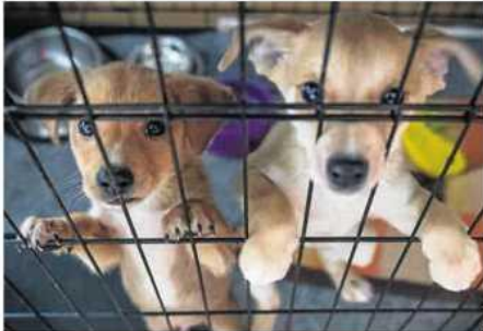
W częstochowskim schronisku dla bezdomnych zwierząt przebywa około 200 psów i 70 kotów

Termin zakończenia inwestycji to 15 listopada 2019 roku.