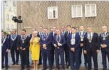
fol. Związek Miast Polskich

Prezydent Częstochowy Krzysztof Matyjaszczyk bierze udział w ogólnopolskich obchodach „Święta Wolności i Solidarności” organizowanego w 30. rocznicę pierwszych częściowo wolnych wyborów w Polsce, które odbywają się w Trójmieście.