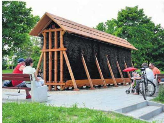
Od pierwszych dni funkcjonowania częstochowska tężnia jest oblegana przez mieszkańców