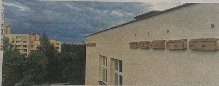
Budki dla ptaków na siedzibie szkoły podstawowej nr 48 przy ul. Schillera w dzielnicy Północ

tenywnych prac był 2018, kiedy kompleksowe termomodernizacje zakończono aż w siedmiu obiektach: szkołach podstawowych nr 8 (ul. Szczytowa), 48 (ul. Schillera), 49 (ul. Jesienna), 50 (ul. Starzyńskiego), 52 (ul. Powstańców Warszawy), 53 (ul. Orkana) oraz w bursie miejskiej przy ul. Legionów.