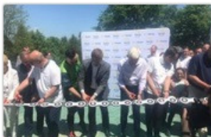
fol. Urząd Gminy Olštyn

W niedzielę, 19 maja oficjalnie otwarta została 2,5-kilometrowa droga ze szlakiem rowerowym z Olštyna na Odrzykoń. To efekt porozumienia dotyczącego rowerowego połączenia gminy Olštyn z Częstochową.