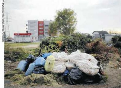
Kontener na odpady zielone na Parkłtce

Miasto postanowiło położyć temu kres. Przygotowało projekt uchwały, która całkowicie zmieniła zasady gospodarowania odpadami zielonymi. Została ona przyjęta przez radnych - zarówno koalicji SLD-RO, jak i PIS - z zadowoleniem i w czwartek przegłosowana. Uchwała zakłada likwidację kontenerów na odpady zielone. Od momentu, kiedy wejdzie ona w życie, mieszkańcy będą mieli prawo oddać trawę czy liście bezpośrednio firmie odbierającej odpady. Można je będzie wrzucać do pojemnika na śmieci biodegradowalne, na popiół - jeśli nie jest on akurat wykorzystywany - lub po prostu do worków. A że odpady zdrewniałe, czyli np. gałęzie, do pojemników i worków się nie zmieszczą, to jeszcze przez rok lub półtora w różnych punktach miasta pojawią się na nie kilka kontenerów, ale tylko czasowo, np. na ty-