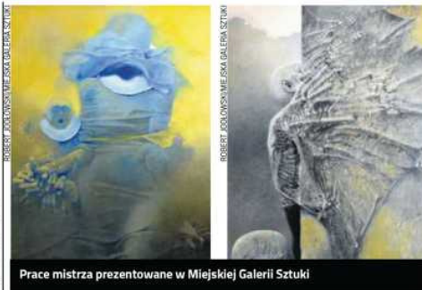
Prace mistrza prezentowane w Miejskiej Galerii Sztuki

Tu przypomnijmy, że w 2014 roku Miejska Galeria Sztuki ogłosiła już konkurs artystyczny dla uczniów średnich szkół plastycznych i stu-