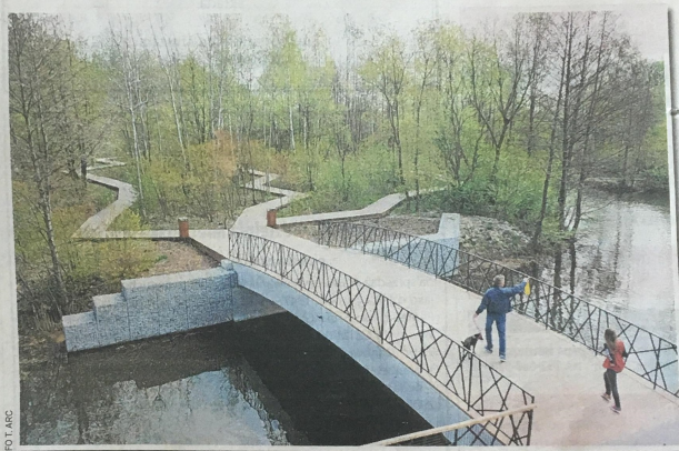
W parku wybudowano kładkę nad kanałem łączącym Bałtyk z Adriatykiem, system pomostów. Jest pawilon plażowy z tarasem widokowym, część gastronomiczna

Teren jest oświetlony i monitorowany. Są nowe ławki, stojaki rowerowe oraz droga dojazdowa z aleją dla pieszych i parkingiem. Nie zapomniano o zieleni. Wprawdzie wycięto 62 drzewa, które kolidowały z plażą, ale zasadzono 102, kilkuletnie drzewa. Zaczynają kwitnąć ozdobne wiśnie japońskie. Inwestycja kosztowała prawie 8,8 mln zł, wydanych z miejskiego budżetu, bowiem tego rodzaju inwestycje nie mieszczą się teraz w programach unijnych. Pierwszy etap