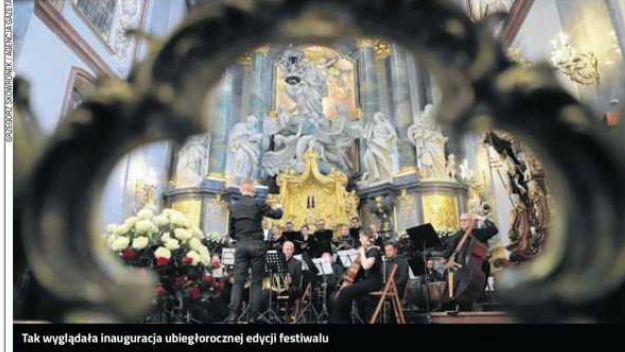
Tak wyglądała inauguracja ubiegłorocznej edycji festiwalu

Przed nami 29. edycja. Potrwa ona jednak znacznie krócej niż zazwyczaj, bo tylko trzy dni. Organizatorem wydarzenia jest Ośrodek Promocji Kultury „Gaude Mater”, a partnerami miasto, Jasna Góra, Filharmonia Częstochowska oraz Kościół Ewangelicko-Augsburski.