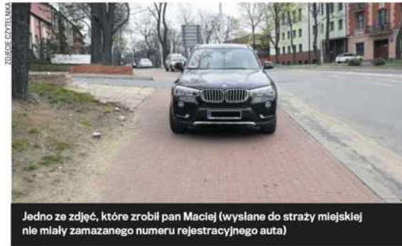
Jedno ze zdjęć, które zrobił pan Maciej (wysłane do straży miejskiej nie miały zamazanego numeru rejestracyjnego auta)

Rzecznik: - Na podstawie zdjęć i opisu sytuacji np. nie wiadomo, czy wg zgłaszającego pojazd przeszkadzał tylko zgłaszającemu czy też tamował lub utrud-