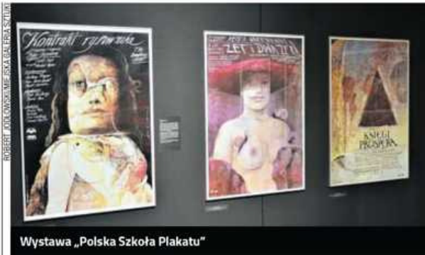
Wystawa „Polska Szkoła Plakatu”

By jeszcze bardziej przybliżyć częstochowianom wartość zbioru, galeria zaprasza na zwiedzanie wystawy pod opieką jej kuratorki Barbary