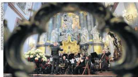
Koncert inauguracyjny ubiegłorocznego festiwalu „Gaude Mater”

XXIX Międzynarodowy Festiwal Muzyki Sakralnej „Gaude Mater” rozpocznie się w sobotę 4 maja o godz. 17 wermisami dwóch wystaw: ikon Jadwigi Marii Kowalskiej oraz fotografii Zbigniewa Burdy. Będą one prezentowane w sali OPK „Gaude Mater”. Dzień później o godz. 16 w kościele ewangelicko-augsburskim przewidziano koncert z okazji 200. rocznicy urodzin Stanisława Moniuszki.