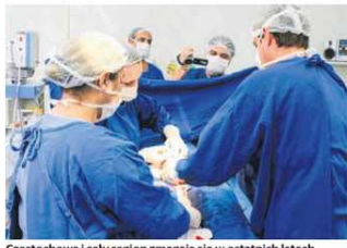
Częstochowa i cały region zmagają się w ostatnich latach

Na razie niezrealizowany pozostaje inny pomysł, który pojawił się podczas ostatniej kampanii wyborczej. Senator Artur Warzocha podczas jednej z konferencji na Uniwersytecie Humanistyczno-Przyrodniczym im. J. Długosza, zapowiedział starania o utworzenie na uczelni wydziału lekarskiego. Największym problemem w tym przypadku jest jednak utworzenie szpitala lub oddziałów klinicznych w Częstochowie. ©