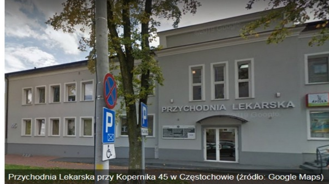
Przychodnia Lekarska przy Kopernika 45 w Częstochowie

W konkursie na podmiot leczniczy, który zorganizuje i przeprowadzi program „Profilaktyka stomatologiczna dla uczniów klas II szkół podstawowych zlokalizowanych na terenie Częstochowy w zakresie zapobiegania próchnicy zębów na lata 2017 - 2021” wygrała Przychodnia Lekarska przy ul. Kopernika 45 w Częstochowie.