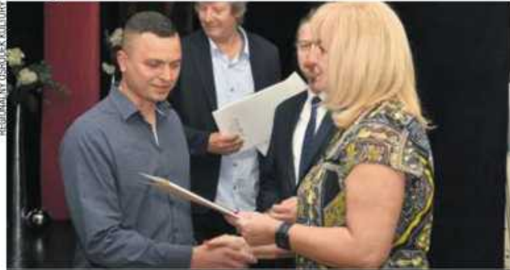
Finał konkursu „Cyberfoto 2019”